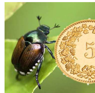
Figura 1: coleottero giapponese a confronto con una moneta da 5 cts.

Il coleottero giapponese ( Popillia japonica , Pj), classificato come organismo di quarantena prioritario, si distingue per la presenza di ciuffi pelosi bianchi (5 laterali e 2 più grandi nella parte posteriore) e per le sue piccole dimensioni, ovvero inferiori a una moneta di 5 cts (Figura 1). Esistono altri coleotteri molto simili coi quali ci si può confondere durante la determinazione. Nella Figura 2 sono illustrate le specie di insetti più comuni simili a Pj.