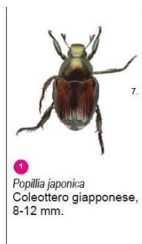
1 Popillia japonica Coleottero giapponese, 8-12 mm.