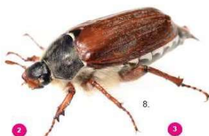
2 Melolontha melolontha Il comune maggiolino, 25-30 mm, non possiede ciuffi bianchi.