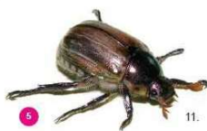
5 Mimela junii Il giugnino Mimela junii , 13-16 mm, possiede elitre di colore verde dorato e molti peli diffusi che non si distinguono in ciuffi bianchi. Ha una forma più ovale rispetto al coleottero giapponese.